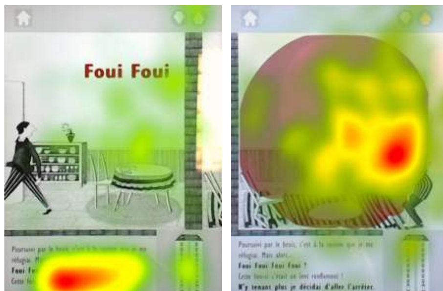
Figure 5. Exemple de carte de chaleur pour un enfant se focalisant sur le texte (gauche) et exemple de carte de chaleur pour un enfant se focalisant sur les illustrations et les enrichissements ludiques (droite)

Concernant la compréhension de l'histoire, il n'y a pas de différence significative entre les lecteurs et les non-lecteurs, et cette compréhension est globalement bonne pour la version imprimée. Par contre, pour la version numérique, la compréhension est significativement moins bonne chez les enfants se focalisant sur les illustrations et les enrichissements. Les observations ont permis de constater que les enfants se focalisant sur le texte n'ont pas ou ont peu utilisé les enrichissements, alors que les autres enfants les ont utilisés à chaque fois ou presque. Certains d'entre eux sont même passés à la page suivante sans attendre la fin de la lecture de la page. Avec une attitude davantage tournée vers l'interactivité, leur attention ne s'est manifestement pas portée principalement sur l'histoire, d'où leur compréhension moindre.