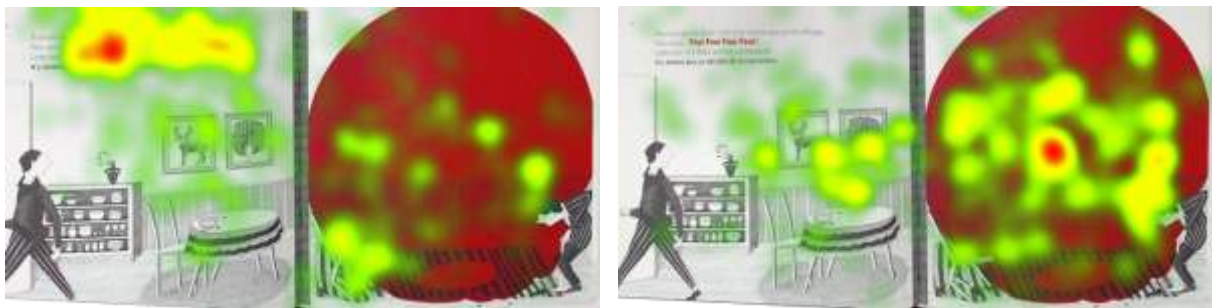
Figure 4. Exemple de carte de chaleur pour un enfant se focalisant sur le texte (gauche) et exemple de carte de chaleur pour un enfant se focalisant sur les illustrations (droite)

Contrairement à ce que notre hypothèse sur l'attention visuelle envisageait, les enfants sachant lire ne se sont pas nettement focalisés sur le texte (seulement deux tiers). De même pour les non-lecteurs et les illustrations. L'analyse des données oculométriques a révélé que ce sont surtout les enfants jouant peu ou moyennement aux jeux vidéo qui ont passé plus de temps sur le texte (qu'ils sachent lire ou non) et les enfants jouant beaucoup aux jeux vidéo qui ont passé plus de temps sur les illustrations (et les enrichissements pour la version numérique), de la même manière pour les deux versions (voir figures 4 et 5).