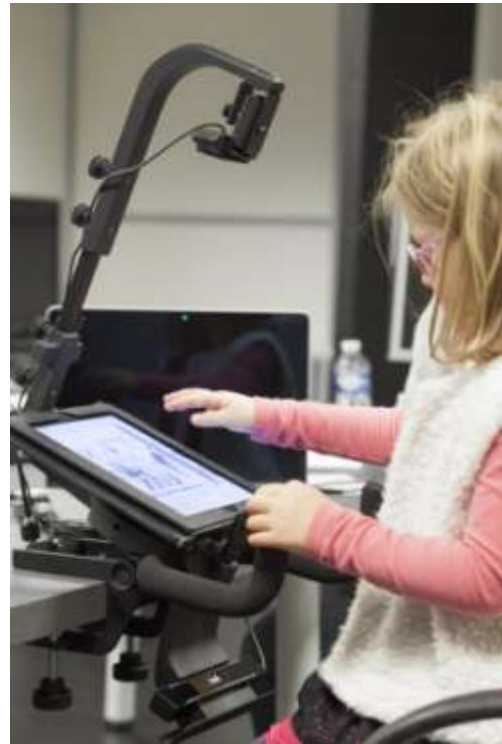
Figure 1. Le livre Mon voisin et son adaptation numérique enrichie lors du test utilisateur

Les intentions de conception de l'adaptation enrichie ont porté en particulier sur la navigation dans le contenu et sur les enrichissements. Pour la navigation, il a été choisi un défilement horizontal pour la visualisation des doubles-pages et un défilement vertical pour avancer dans l'ouvrage (chaque double-page correspond à l'étage d'un immeuble que le lecteur découvre de bas en haut, notons que la navigation numérique ajoute une vue de l'immeuble mettant en évidence l'étage courant). Concernant les enrichissements, ils ont été pensés sous l'angle ludique. Du côté gauche de chaque étage (voir figure 2), la possibilité de réécouter les onomatopées (plus ou moins fort) en les déplaçant (plus ou moins près du mur central) a été ajoutée. Et du côté droit, la possibilité de faire réapparaître les éléments en couleur en penchant la tablette (sachant que ces éléments disparaissent une fois la page affichée) a été ajoutée.