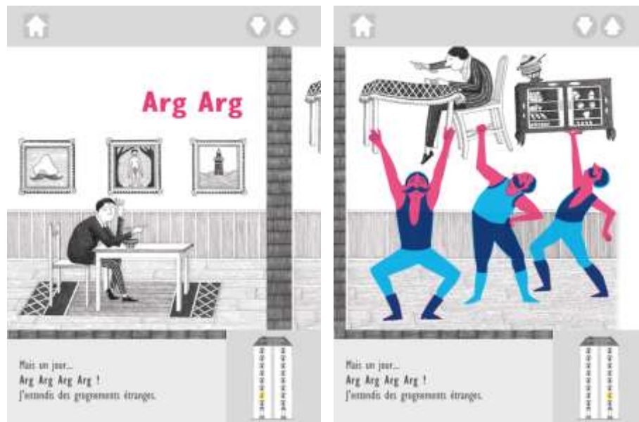
Figure 2. Copies d'écrans du prototype d'adaptation (côté gauche et côté droit)

L'objectif principal de cette expérimentation était de se demander dans quelle mesure ces activités ludiques enrichissaient vraiment l'expérience. Pour cela, elle a pris la forme d'un test utilisateur 4 visant à comparer l'activité de lecture entre les deux versions (le livre et son adaptation numérique enrichie) ainsi que les retours des lecteurs. L'étude a porté en particulier sur l'attention visuelle (grâce aux données oculométriques issues du suivi de la position du regard), la compréhension de l'histoire (grâce à des reformulations de l'histoire), l'utilisation des enrichissements (pour la version numérique) et les avis des lecteurs. Le test a été réalisé avec 20 participants, des enfants de 5 à 9 ans, garçons et filles, certains sachant lire et d'autres non.