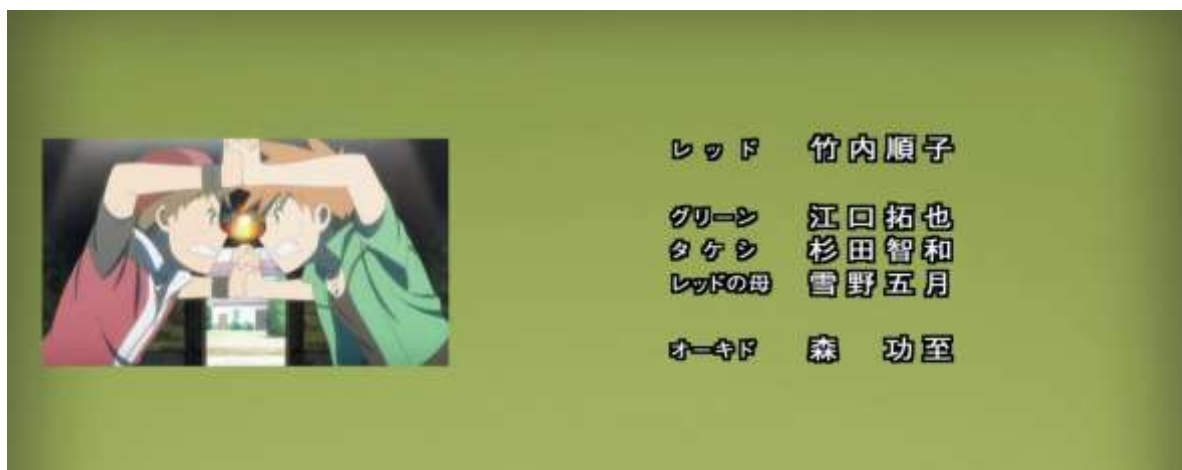
Figure 9. Crédits du générique de fin de Pokémon : les Origines 26

En plus des imitations intermédiaires qui consistent à mêler les éléments du média ludique au média animé, Pokémon : les Origines regorge d'éléments citationnels qui n'ont de sens que si l'on connaît le jeu. Le deuxième épisode commence par le chargement de la sauvegarde précédente où l'on remarque que le temps de jeu affiché diffère de celui présenté à la fin du premier épisode en passant de 1:24 à 8:22 :