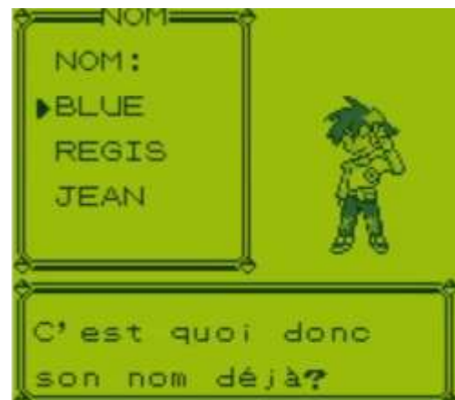
Figure 5. Sélection du nom Red et Blue 20

Nous passons rapidement sur des points de détails de la suite de l'épisode ; l'architecture