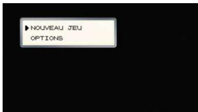
Figure 3. Cartouche de menu dans le jeu 16 et dans Pokémon : les Origines 17

L' anime prend même le temps de rendre actif ce menu en simulant une navigation entre les boutons « Nouveau jeu » et « Options » accompagnée de bips imitant l'environnement sonore du jeu. La ressemblance est cultivée jusque dans la police de caractères qui se trouve pixellisée et en lettres majuscules comme dans le jeu. Il s'ensuit un monologue qui respecte on ne peut plus