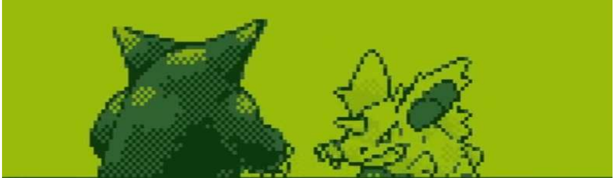
Figure 1. Le combat inaugural dans le jeu 9

Pour faire apparaître les représentations de l'expérience ludique dans l' anime , nous avons donc choisi de travailler sur les ouvertures du jeu vidéo Pokémon Rouge / Vert / Bleu , de la série principale Pokémon : la Ligue Indigo , et de la mini-série Pokémon : les Origines . Le jeu vidéo débute par une cinématique mettant en scène un combat entre deux Pokémon :