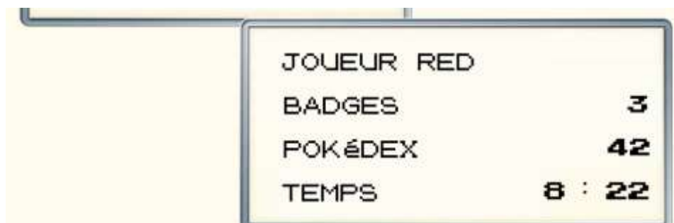
Figure 10. Écran « Continuer 27 »

En plus des imitations intermédiaires qui consistent à mêler les éléments du média ludique au média animé, Pokémon : les Origines regorge d'éléments citationnels qui n'ont de sens que si l'on connaît le jeu. Le deuxième épisode commence par le chargement de la sauvegarde précédente où l'on remarque que le temps de jeu affiché diffère de celui présenté à la fin du premier épisode en passant de 1:24 à 8:22 :