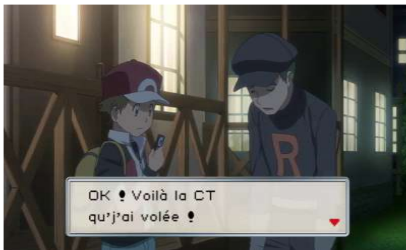
Figure 11. Illustration du sommaire 28

Ce sommaire ne représente pas seulement l'expérience ludique dans la forme qu'il adopte (via les cartouches textuels), mais aussi à travers les éléments mentionnés qui n'ont de sens que dans le jeu ou si l'on connaît le jeu. Red évoque l'obtention d'objets de l'inventaire : une « CT », une « canne à pêche », la « CS01 », la « bicyclette » et le « bon de commande ». En connaissant le jeu, on peut même déduire qu'il a obtenu un « fossile » suite à son combat avec « l'intello » et que la CT dont il parle est la CT28. Il parle aussi d'aspects relatifs aux combats : la victoire face à trois champions d'arène (Pierre, Ondine et Major Bob), le combat face à un « intello » et un « sbire rocket » (qui sont des classes génériques d'adversaire dans le jeu), son désavantage face au type eau, l'obtention de niveaux par son Pokémon. Nous imaginons que les spectateurs ou les lecteurs de cet article n'ayant jamais joué à Pokémon doivent être bien en peine de comprendre ce que sont les CT et les CS 29 ; l'impasse faite sur ces explications nous montre que cet anime est fait pour flatter les joueurs et que c'est à eux qu'il s'adresse. Dans la série principale en revanche, on ne parle jamais de CT ou de CS et il est même rare que l'on parle du gain d'expérience et de la montée en niveau des Pokémon, ces deux points y apparaissent comme des notions vagues alors que ce sont des éléments cruciaux du gameplay et bien connus des joueurs.