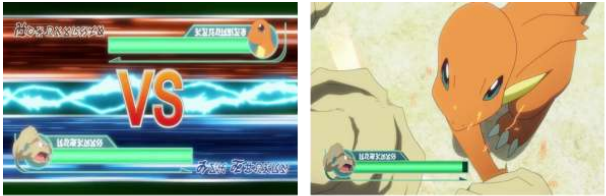
Figure 7. Écran splitté et jauge de point de vie 23

Red sort victorieux du combat et l'épisode se clôt sur une interface de sauvegarde qui va jusqu'à imiter les limitations techniques du jeu d'origine. Comme le montre la figure 8, le mot Pokédex comporte un « é » en bas de casse alors que le reste du mot est en haut de casse puisque le jeu ne disposait pas d'un set de caractère contenant le « É ». Cela nous montre que l'intention de fidélité est très poussée :