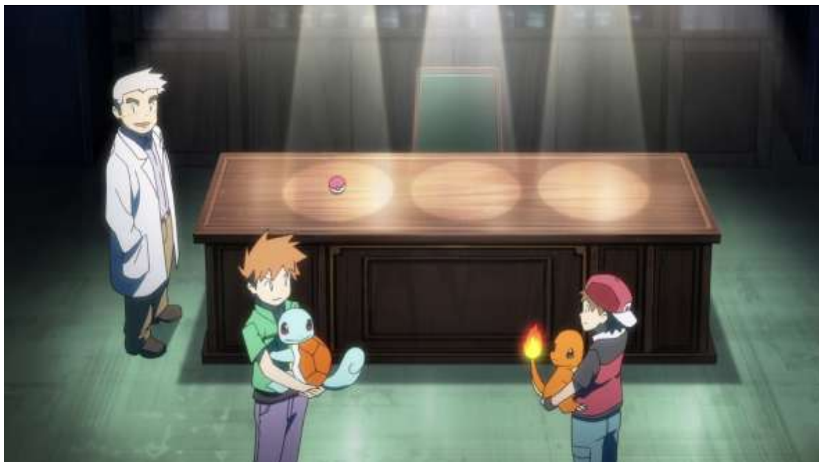
Figure 6. Mise en scène de la table avec les trois starters 21

de la maison de Red est semblable à celle du jeu, le personnage descend de sa chambre située au premier étage où il retrouve sa mère puis se rend au laboratoire du professeur Chen pour se voir remettre son starter ainsi que son Pokédex. Red choisit un Salamèche (sachant que le Pokémon qui illustre la jaquette de la version Rouge est son évolution finale, Dracaufeu), son rival prend le Pokémon du type avantagé.