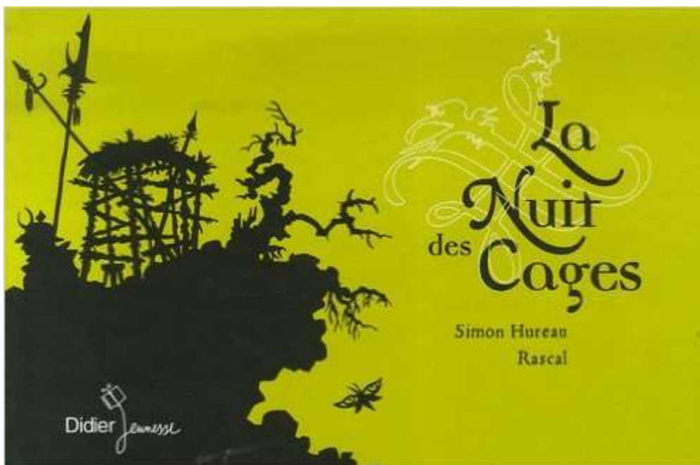
La nuit des cages, Première de couverture

Pourquoi et comment lisons-nous de la littérature de jeunesse ? Quel lecteur sommes-nous ? Les lectures personnelles d'une œuvre pour la jeunesse, en tant qu'adulte, les lectures de cette même œuvre à des enfants, en tant que médiateur, et les lectures enfantines semblent a priori éloignées les unes des autres du point de vue de la réception. Cet article propose d'analyser, à partir d'un parcours personnel qui sera restitué chronologiquement, la mise en œuvre de différentes pratiques de lecture, afin de mieux cerner certains processus en jeu (mobilisation de structures cognitives et affectives) dans l'acte de lire. La lecture d'un album que nous ne connaissions pas, La nuit des cages de Simon Hureau et Rascal 1 , permet à la fois de privilégier une réelle découverte et de se rapprocher de la posture de l'enfant lors de son premier contact avec le livre. L'album, grâce à sa double « énonciation » (texte et images), se prête particulièrement bien à ce jeu des variations des postures et des modalités de lecture, invite à des observations et des interprétations qui créent de nombreuses passerelles entre les lectures et réceptions de l'adulte-médiateur-lecteur et celles de l'enfant-lecteur.