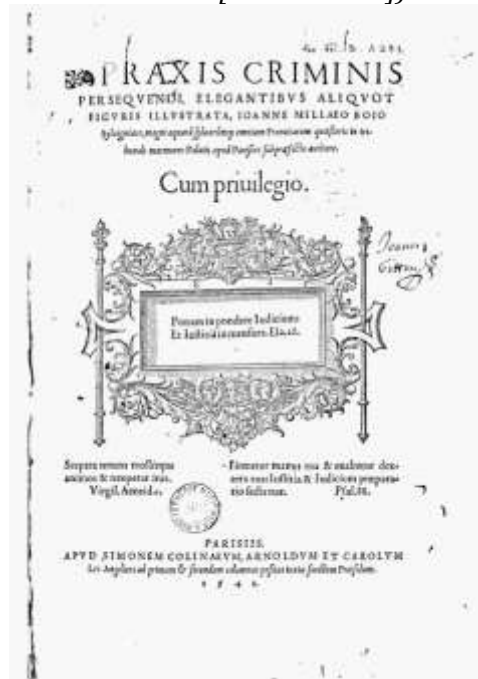
Praxis criminalis , p. 5 Page de titre

Fichiers 3-4 : Praxis criminalis :