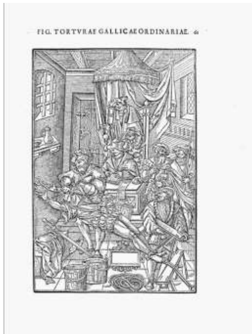
Praxis criminalis, p. 133 : le supplice de l'eau

Légende : Le prévenu est allongé, les bras étirés au-dessus de sa tête et attachés à des anneaux fixés au murs, les pieds réunis et également attachés fermement. La bouche du prévenu est recouverte d'un linge sur lequel on verse une grande quantité d'eau alors même que son nez est maintenu bouché : la respiration devient extrêmement difficile, le sujet appréhende le risque d'une mort par asphyxie ou par noyade.