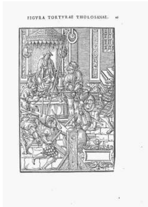
Praxis criminalis, p. 135 : l'estrapade

Légende : Le prévenu a les mains attachées derrière le dos par un premier cordage étroitement serré par deux bourreaux placés de côté et d'autre de sa personne. Un second cordage enserrant son bras droit à la hauteur de l'épaule passe par une poulie attachée au plafond. Le supplice consiste à hisser l'homme jusqu'au plafond à l'aide de la poulie puis à le relâcher brutalement. Le bourreau peut ajouter un poids au pied de l'accusé, comme ici.