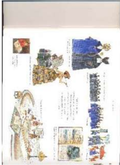
Figure 6 « l'art de la cartographie pouvait à lui seul embrasser la totalité des sciences de la nature »

© Editions Casterman S.A./ François place