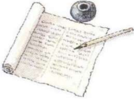
Figure 5 « les mirages de l'encre noire »

© Editions Casterman S.A./ François place