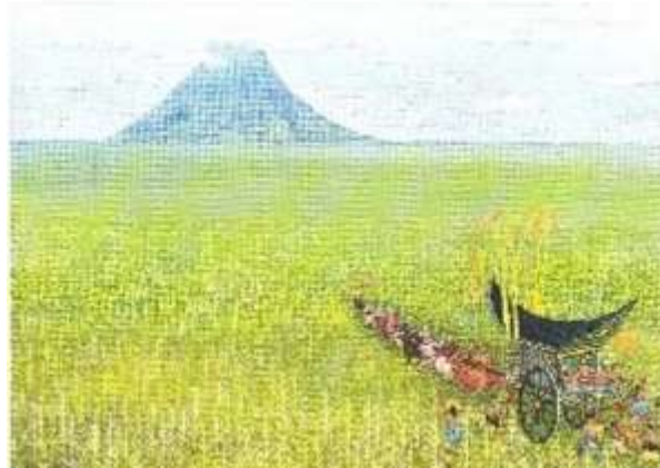
Figure 2 « la composition, le jeu des lignes et des points de fuite semblent étirer l'image aux dimensions du monde »

© Editions Casterman S.A./ François place