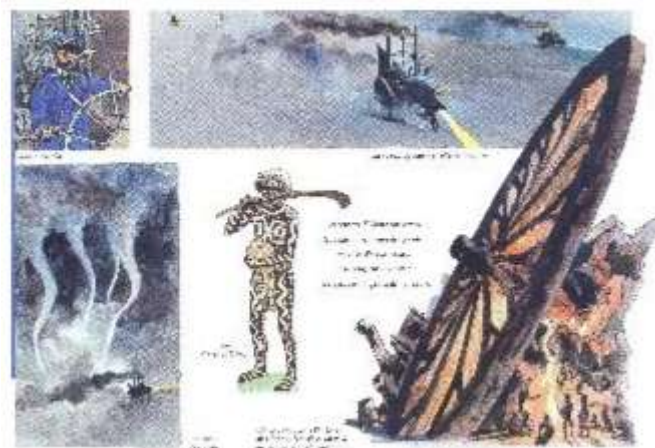
Figure 3 « la victoire des sociétés dites primitives sur les tentatives impérialistes des grandes nations »

se place résolument du côté d'une géographie imaginaire ; ensuite parce que le précédent volume illustre l'emprise de la civilisation européenne sur l'univers mythologique des géants, tandis que celui-ci met en scène en de multiples occasions la victoire des sociétés dites primitives sur les tentatives impérialistes des grandes nations de la conquête coloniale. Exemplaire à cet égard telle page 18 aux allures de bande dessinée ou d'histoire sans paroles, résumant en quelques vignettes lapidaires le mouvement parabolique qui organise le déclin de l'Occident : l'Occident positiviste incarné par un héros qu'on croirait sorti de chez Jules Verne comme pour mieux consacrer le triomphe de la civilisation mécaniste sur les espaces barbares du Désert d'Ultima se découvre ultimement ravalé au rang de totem, métamorphosé en un grand scarabée vaguement kafkaïen que les sorciers s'empressent d'intégrer à leur mythologie qui en fournit dès lors le sens second. Le phénomène semble d'ailleurs se faire de plus en plus insistant au fil de l'œuvre, le troisième tome étant presque tout entier placé sous le signe du choc des cultures et de la suprématie des grands anciens sur la modernité. On assiste en somme à un rééquilibrage des valeurs après le constat désenchanté des Géants : inscrit sous les auspices de l'anthropologie interculturelle, l'Atlas promeut une vision post-coloniale de l'humain au nom du droit à la différence et de la reconnaissance de l'altérité.