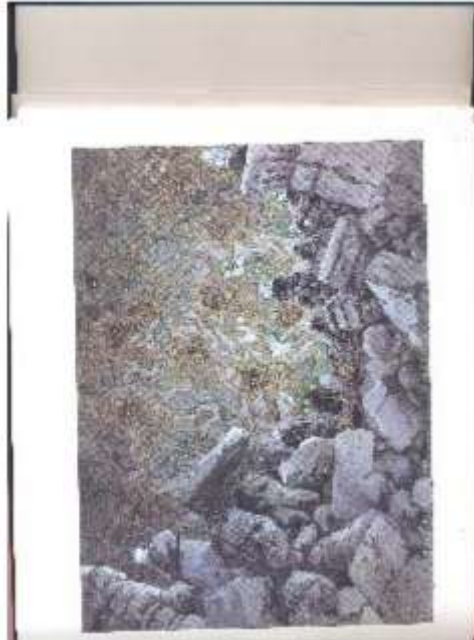
Figure 7 « Soit la chambre noire d'une psyché plongée dans l'obscurité de ses fantaisies ou bien de ses fantasmes »

de la psychologie cognitive ou des théorisations critiques du sujet lecteur. Telle est d'ailleurs la réponse plutôt inattendue que l'auteur donne à un journaliste lui demandant « quel pourrait être le fil rouge de l'univers François Place » : « En définitive, ce qui me guide le plus, peut-être, c'est quelque chose autour de la lecture et de la transmission 25 ».