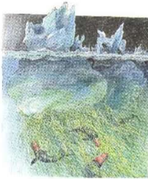
Figure 4 « la pensée consciente est insuffisante à rendre compte des profondeurs cachées »

© Editions Casterman S.A./ François place