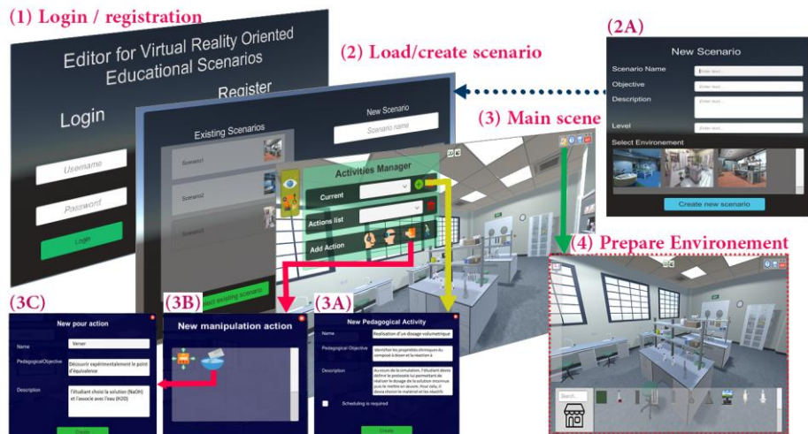
Fig. 3. Définition des actions de RV à réaliser au sein de l'activité pédagogique

Dès lors que l'on se place dans un contexte interactif, la scénarisation pédagogique ne consiste plus uniquement en « la modélisation d'un scénario », mais également en « la mise en place des mécanismes » nécessaires à la réalisation de ce scénario [29]. Par ce fait, nous avons développé un éditeur de scénarios qui facilite la création des situations pédagogiques modélisées. L'objectif est de permettre la création et l'adaptation des différents composants d'un scénario pédagogique notamment les environnements d'apprentissage, les activités pédagogiques et leur organisation.